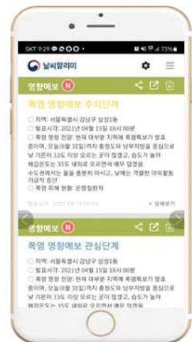
<영향예보, 생활기상지수 수신 설정 및 알림서비스 메시지 예시>